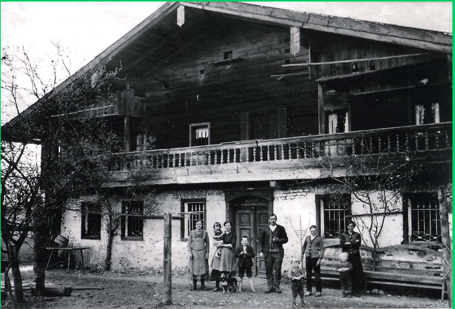
Das Schöschar-Gut 1926

Hier wohnte der Riese von 1862 bis zum Beginn seiner Reisen