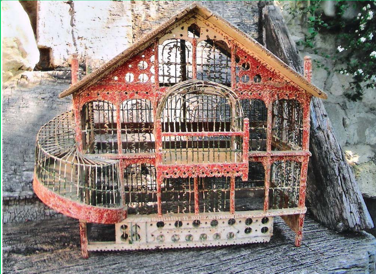
Vogelkäfig – vom Vater des Riesen angefertigt - Heimatmuseum Zell am Moos