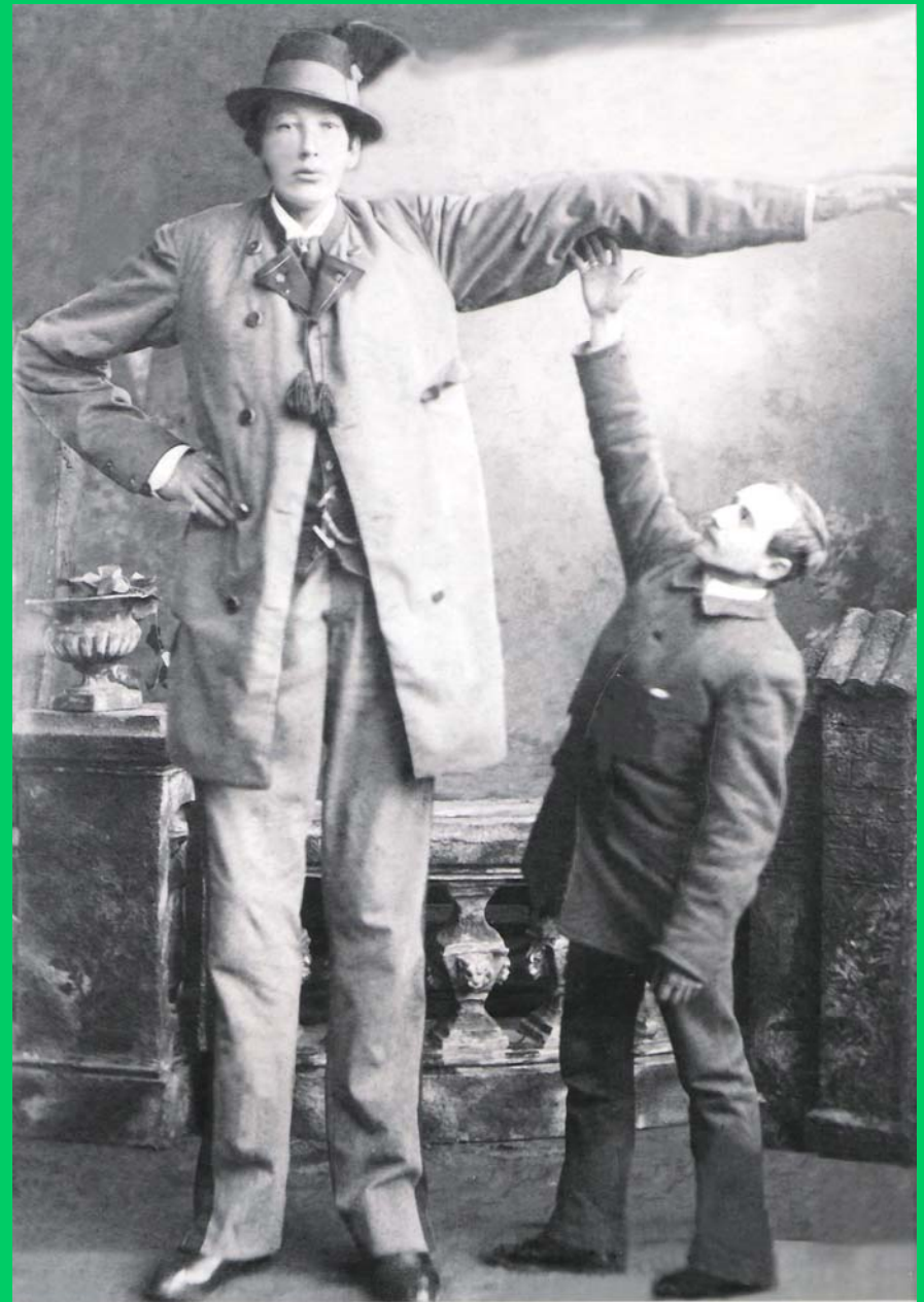
Der Lengauer Riese mit Klammer-Schneider um ca. 1882

Alle Verkaufsartikel dienen dazu, Projekte zu finanzieren.